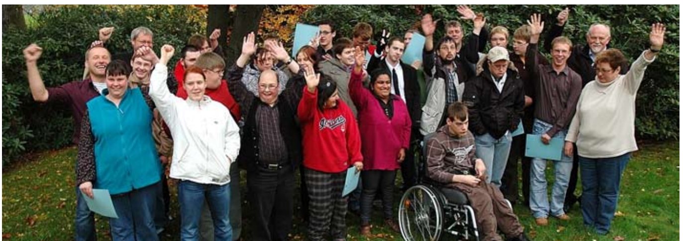
Sie freuen sich: Diese jungen Menschen haben ihre Berufsbildung erfolgreich absolviert und starten in vielen Bereichen der Werkstatt in ihr Berufsleben.

leistet täglich seinen Beitrag zur Kerzenherstellung in der Betriebsstätte Heckenweg in Lengerich. Seit einiger Zeit befüllt er auch die anspruchsvollen Formen mit Wachsstückchen. Eine junge Frau beweise ihre Fähigkeiten bei der K-lumet-Produktion und gehe geschickt mit Nadel und Faden um, berichtet Mitarbeiterin Doris Jürgens.