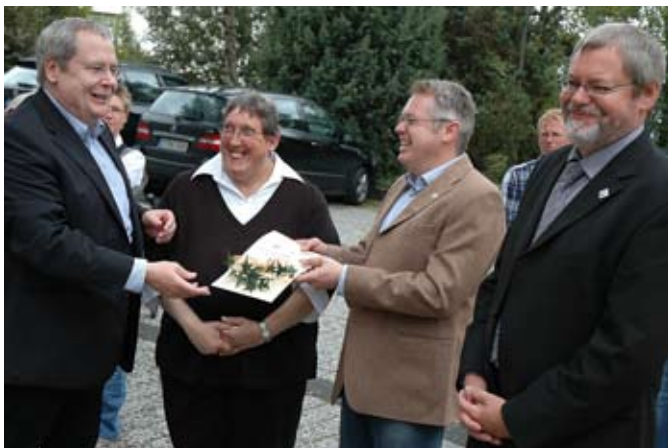
Gut gelaunt und mit kleinen Geschenken wird das Jubiläum im Wohnbereich Waldfrieden 22 gefeiert.

auch Skepsis habe es gegeben. Doch über 20 Jahre hätten sich viele kleine Dinge getan und es habe eine gute Entwicklung ihren Lauf genommen. Heute sei Behinderung eben „kein reines Familienthema mehr“, sondern das weitgehend selbstbestimmte Leben das Ziel.