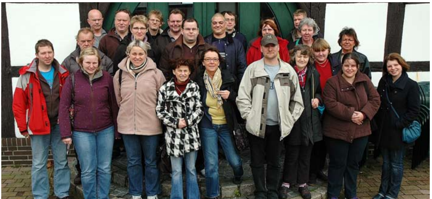
Menschen mit psychischen Behinderungen haben gemeinsame Seminartage in der Evangelischen Jugendbildungsstätte Tecklenburg verbracht.